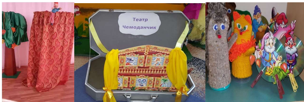
Рисунок 3. Различные виды театра

Беседы по литературным произведениям. На данном этапе мы на примере литературных произведений, доступных детскому восприятию, объясняли, рассуждали какой смысл люди вкладывают в гуманные качества, такие как, добро, сочувствие, отзывчивость, вежливость, доверие и т.д. В качестве произведений использовали: «Крылатый, мохнатый, масляный», «Морозко», «Лиса и рак», «Аленький цветочек» С. Т. Аксаков, «Гадкий утёнок» Г.-Х. Андерсен, «Муравьишка» В. Бианки, «Под грибом» В. Сутеев, «Как белочка дятла спасла» В. А. Сухомлинский, «Серебряное копытце» П. Бажов и др.