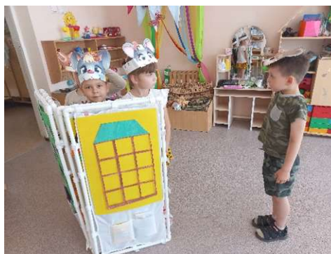
Рисунок 4. Игра-драматизация «Теремок»

Театрализованные игры развивают творческий процесс, знакомят с чувствами и эмоциями различных героев, помогают понять причины их настроения и поведения. На этом этапе мы использовали театрализованные игры: режиссерские и игры-драматизации (рис. 4-6).