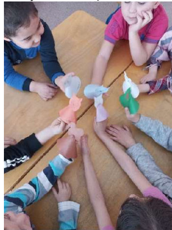
Рисунок 6. Игра «Рукавичка»

На данном этапе мы создавали условия для общения и взаимодействия детей друг с другом, формировали навыки сотрудничества, положительного отношения детей друг к другу.