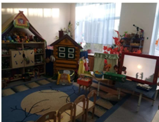
Рисунок 2. Развивающая предметно-пространственная среда группы