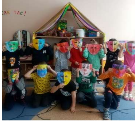
Рисунок 5. Игра «Маски»