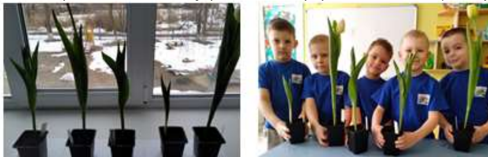
Рис. 9 Вот и долгожданный результат, наши тюльпаны расцвели