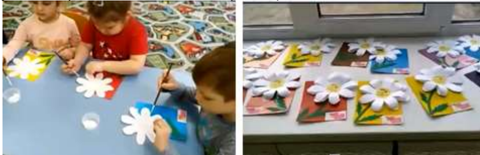
Рис.1 «Цветы из бумаги ко Дню Матери!»

На праздник «День Матери» мы делали мамам цветы из бумаги. Они получились красивые, но не живые (Рис. 1).