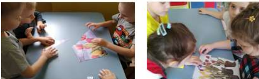
Рис. 8 Дидактические игры: «Что сначала, что потом», «Собери тюльпан» На заключительном этапе подвели итоги проекта: рассмотрели выросшие цветы и готовились подарить их мамам на утреннике «Сюрприз для мамы». (Рис.9)