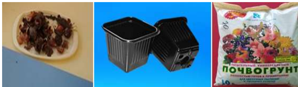
Рис.3 Подготовка материала к посадке тюльпанов