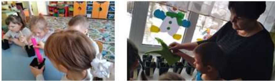
Рис. 6 Полив, рыхление почвы, измерение роста цветов

На занятии «Посадка луковиц тюльпана» выяснили, как правильно высаживать луковицы тюльпанов в грунт, и как за ними ухаживать (Приложение 2). Заполнили горшочки грунтом, посадили луковицы с ростками тюльпанов, полили, поставили на подоконник и начали наблюдать. Ежедневно рыхлили, поливали, поворачивали горшки с тюльпанами к свету разными сторонами, измеряли рост растения (Рис. 6).