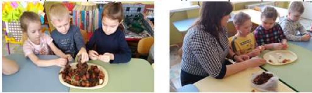
Рис. 5 Трудовая деятельность «Подготовка луковиц к посадке»

Луковицы уже «проснулись» и были готовы к посадке в грунт. Мы подготовили луковицы для посадки: аккуратно очистили их от кожуры, т. к. очищенной луковице легче впитывать необходимые микроэлементы из почвы для полноценного развития (Рис. 4).