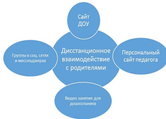
Рисунок 1. Формы дистанционного взаимодействия

Одной из форм дистанционного взаимодействия родителей и педагогов является сайт детского сада . На нем отражена вся административная и правовая информация сада (устав, лицензия, правила приема, список сотрудников, расписание работы, объявления по текущим вопросам, фотоотчеты о жизни сада и т. д.). Кроме того, сайт содержит информацию для родителей по вопросам воспитания и образования ребенка. Обновляемая информация на сайте привлекает к саду повышенное внимание родителей, способствует созданию открытого пространства взаимодействия специалистов и родителей [1].