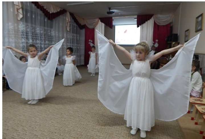
Рисунок 3. Танец «Мама»