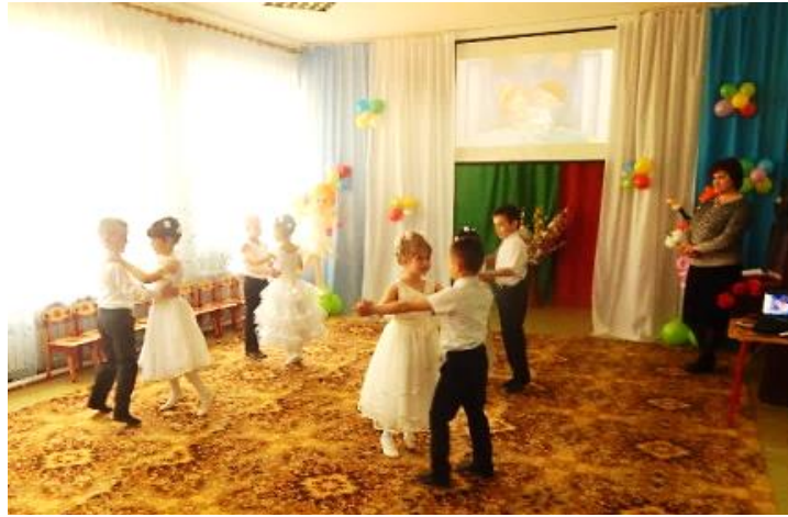
Рисунок 2. Городской конкурс танцев

незамеченными (рис. 3,4). Мы занимаем первые места. Ну, а самое главное – дети здоровы и счастливы.