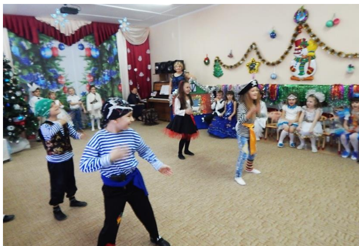
Рисунок 4. Танец разбойников