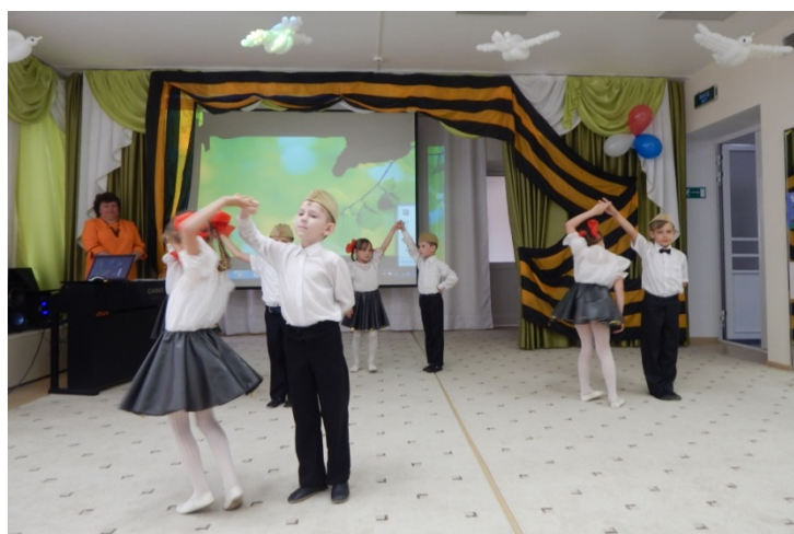
Рисунок 5. Танец «А закаты алые»