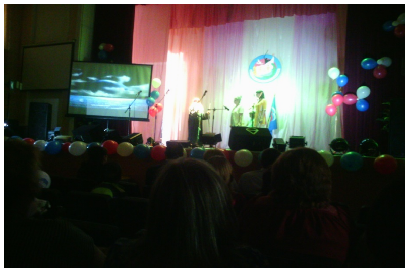
Рисунок.1. Представление совместного творческого проекта «Когда уже нельзя молчать...» на региональном фестивале «Мой край родной - Поволжье»